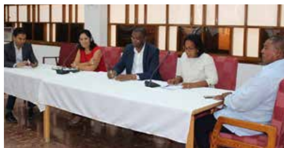
Photo : ONU-Femmes / Cap Vert - Atelier ONU-Femmes au Parlement sur la loi de parité, 2018

Améliorer la participation des femmes signifie que ceux qui ont le pouvoir - généralement les hommes - perdent (une partie de) ce pouvoir. Il est donc important de gagner des alliés pour le projet de loi et de le promouvoir à l'avance 89 .