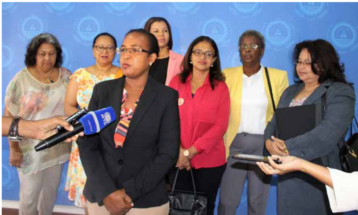
Des femmes parlementaires font le plaidoyer pour la loi de parité, Cap-Vert

Les législateurs, les gouvernements, les experts en matière de rédaction des lois et les organisations de la société civile de l’ensemble de la Région de l’Afrique de l’Ouest et du Centre trouveront des conseils dans ce document. Il s’agit, entre autres, d’informations sur la manière d’évaluer les chances de réussite de l’application des lois relatives aux quotas dans différents contextes et sur les mesures temporaires spéciales qui peuvent être appliquées en fonction des différents contextes constitutionnels et électoraux. Un résumé des bonnes pratiques législatives se trouvent à la fin de ce guide juridique.