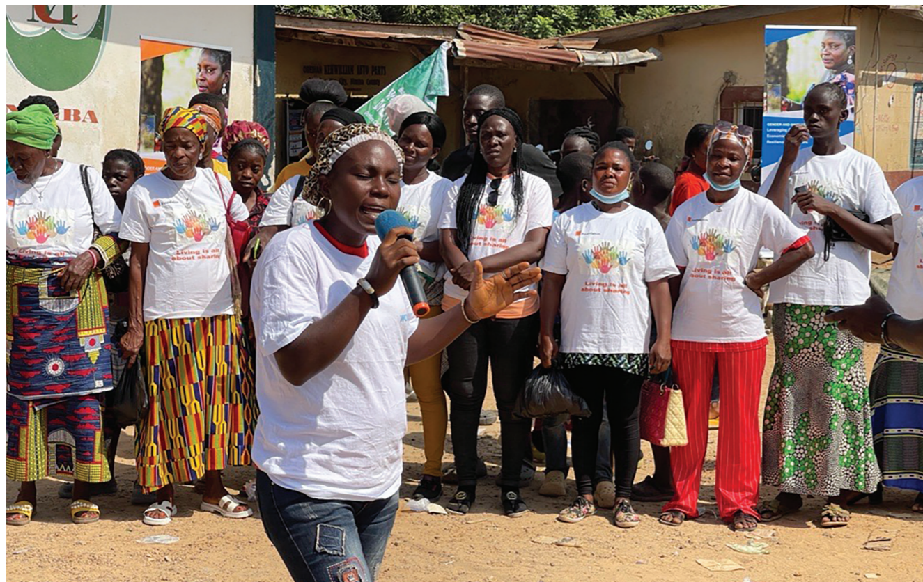
Événement de sensibilisation à la plateforme numérique "Buy from Women" dans le comté de Lofa, au Libéria. Cette initiative soutient le projet "Inclusion numérique pour l'autonomisation économique des femmes" d'ONU Femmes.