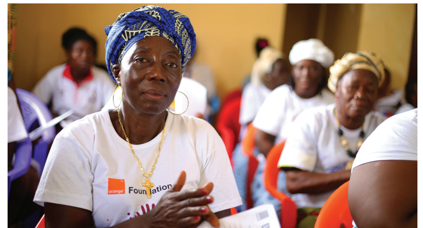
Femmes bénéficiaires du projet Orange participant à des cours d'alphabétisation numérique.

Le partenariat avec Orange a permis au projet d'offrir aux femmes rurales une formation complète à la culture numérique et un accès à la technologie mobile. Cela a permis aux femmes d'exploiter efficacement les services financiers numériques, en facilitant les transactions sécurisées et en élargissant l'accès au marché. En outre, en s'attaquant aux problèmes de connectivité et d'infrastructure dans les zones reculées, le partenariat soutient l'expansion des solutions numériques.